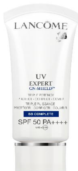
「ランコム UV エクスペール エッセンス イン BB」 (2013年2月発売予定)

さらに、「ラ ロッシュ ポゼ UVアイデアXL BB」、「ヘレナ ルビンスタイン プレミアム UV-AG 50ヌード BBベース」、「イヴ・サンローラン トップ シークレット UV プロテクションベース 50」、「コスマンス アドバンス UVディフェンス EX」、「アニエスベーピークリーム UV50」などにも「PA++++」が適用され、来年から順次、発売します。