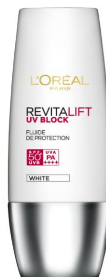
「ロレアル パリ リバイタリフト UV ブロック ホワイト」 (2013年2月発売予定)