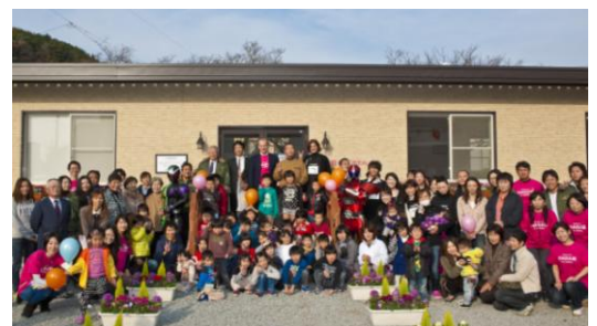
地域の子どもたちや住民の皆さんと