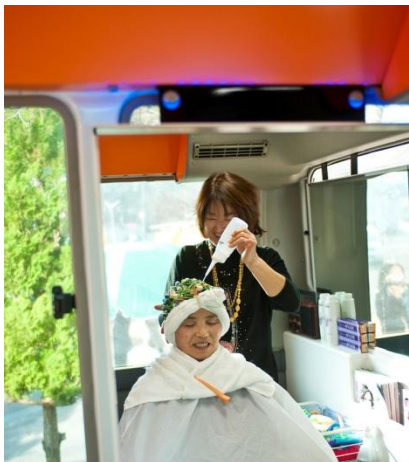
パーマをかけているお客様