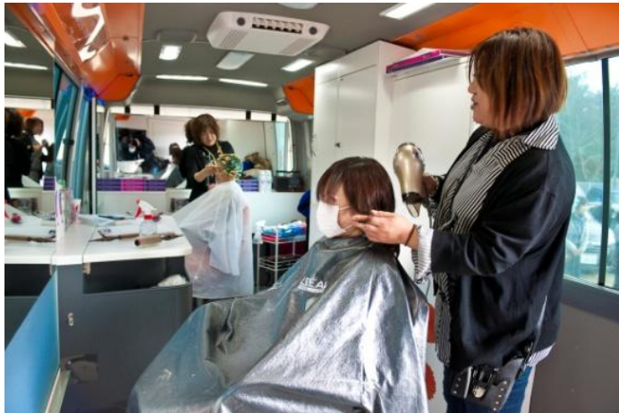
地元同士で、話も盛り上がります