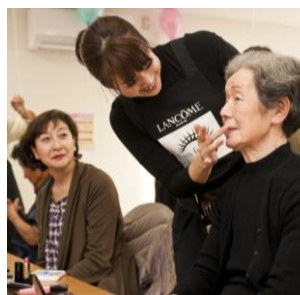
ランコムによるメイクアップ講座