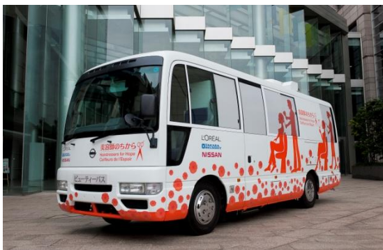
ビューティーバス外観