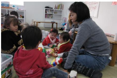
畳の上でおもちゃで遊ぶ子どもたち